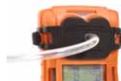
Adaptador para teste de resposta/calibração Para aplicar o gás de teste no T4