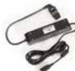
Cabo de interface USB

I-Test A facilidade de uma solução automatizada de teste de resposta e calibração