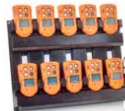
Base de recarga 10 vias Para armazenar e recarregar sua frota de T4