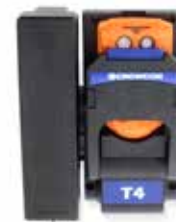
Carregador veicular Comodidade de armazenamento e recarga durante a locomoção