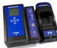
Adaptador de filtro externo Filtro encaixável para ambientes empoeirados

I-Test A facilidade de uma solução automatizada de teste de resposta e calibração